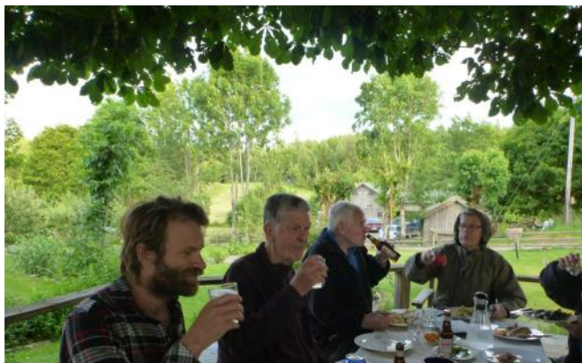
Fika efter slåttern på Örsbråten..