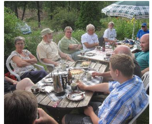
En viktig del av en slåtter är förtäringen efteråt. Här i Långevika 2011.

Välkommen till de vackra slåtterängarna!