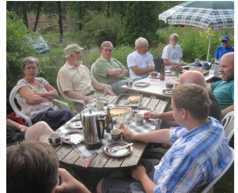
En viktig del av en slåtter är förtäringen efteråt. Här i Långevika 2011.

Välkommen till de vackra slåtterängarna!