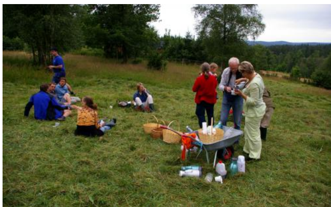
Bryngels gårde, Ödenäs.